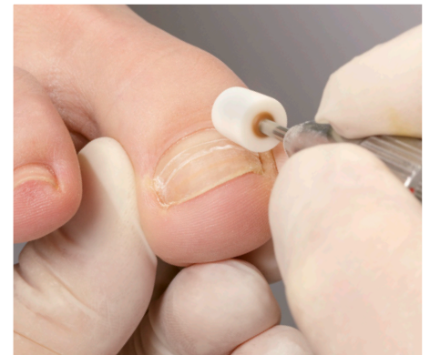
12. Die individuelle Spannungskorrektur

eigenen Rückstellkräfte auf den Nagel. Der Nagel wird sanft, aber sorgsam aus dem seitlichen Nagelfalz herausgehoben. Das physikalische Gesetz von Druck und Gegendruck wirkt dabei in jedem Fall. Denn entweder ist die einwirkende Zugkraft auf Antrieb korrekt – oder sie lässt sich schnell und schonend reduzieren. Dies geschieht durch gezieltes Abschleifen der Spange nach dem Prinzip: Je geringer die Materialstärke, umso geringer ist auch die Zugkraft!