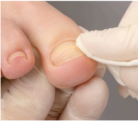
13. Die gewissenhafte Abschlussreinigung