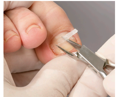
18. Das behutsame Ablösen

werden soll. Drücken Sie die Spange dann mit dem B/S-Stahlappikator – ohne diesen zu verrutschen – über die Breite des Nagels hinweg bis zum gegenüberliegenden Nagelrand an. Ist die Spange zu groß oder zu klein, greifen Sie zur größeren oder kleineren Alternative.