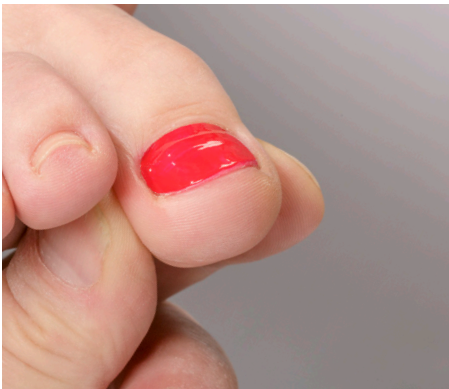
16. Die flankierenden Möglichkeiten: Desinfizieren, Tamponieren, Salbenverbände und Nagellack