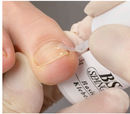
14. Die abschließende Versiegelung