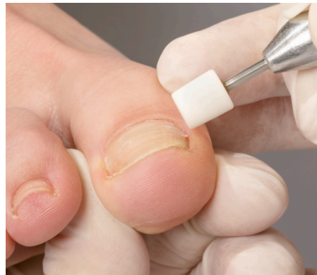
11. Das Angleichen der Spangenübergänge