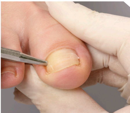
10. Das Andrücken der B/S-Spange links