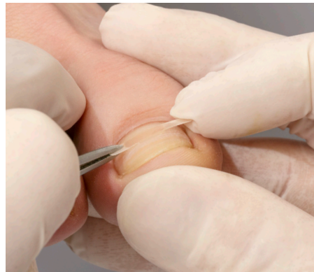
8. Die korrekte Mittenfixierung