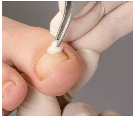
2. Das sorgsame Entfetten