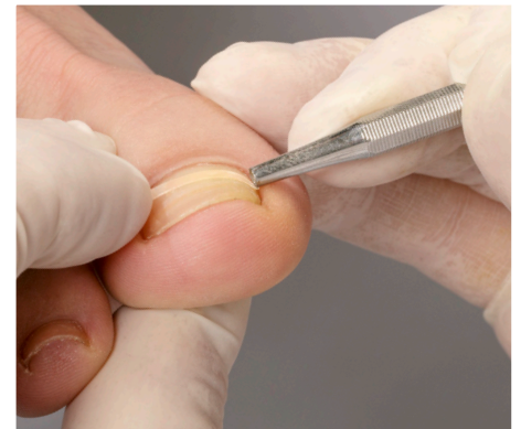
9. Das Andrücken der B/S-Spange rechts