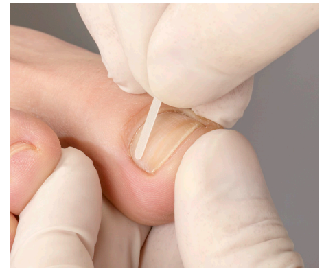
3. Die exakte Anprobe vom Anfang