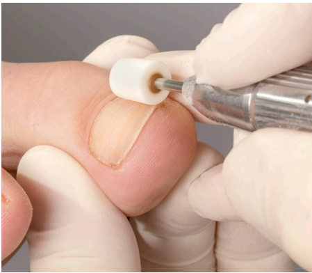
1. Die gründliche Vorbereitung

Wirklich wegweisende Entwicklungen schreiben Erfolgsgeschichte. Die B/S-Spange Classic ist ein ausgezeichnetes Beispiel dafür. Vor mehr als 25 Jahren von Bernd Stolz in Amberg erfunden, hat dieses durchdachte System zur schmerzfreien Korrektur eingewachsener Nägel unzähligen Betroffenen nachhaltig geholfen. Während an der Spange selbst über all die Jahre so gut wie nichts zu optimieren war, sorgt nun der B/S-Aktivator auch bei der Classic-Spange für ein sichereres Aufbringen der Spange auf den Nagel. Grund genug für eine detaillierte Betrachtung dieser sicheren Applikationsmethode.