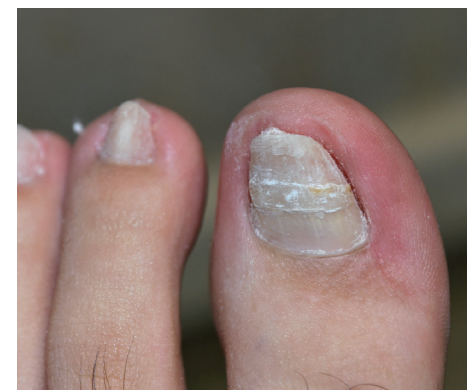
Nach 12 Monaten mit 13 B/S-Spangen

Behandlungsbeispiel eines extremen Rollnagels mit der B/S-Spange. Durchgeführt und fotografiert von Frau Maria Merkouris, einer Kollegin aus Griechenland.