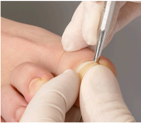
4. Die exakte Anprobe bis zum Ende