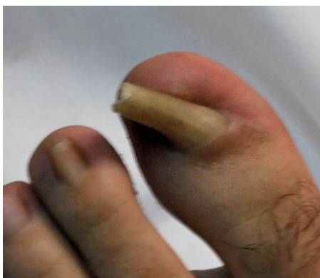
Extrem gerollter Nagel