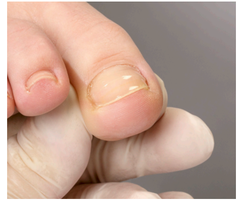
15. Das überzeugende Ergebnis