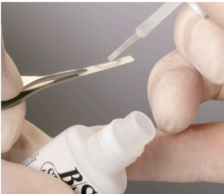
7. Das Auftragen des B/S-Basic-Klebers