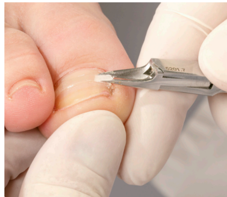
17. Das Entfernen der B/S-Spange: Anlösen der B/S Spange am seitlichen Ende