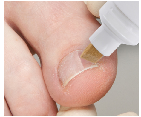
6. Das Auftragen des B/S-Aktivators