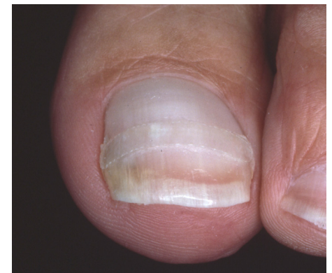
Nach 11 Monaten mit 8 B/S-Spange

Korrekturbehandlung eines stark eingewachsenen Großzehennagels. Nach 11 Monaten mit 8 B/S-Spangen konnte ein hervorragendes Ergebnis erzielt werden - mit sofortiger Schmerzfreiheit seit Beginn der Behandlung.